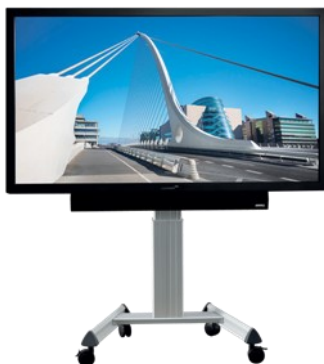
Mobile elektrische Höhenverstellung